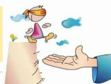
FIGURA DE CONFIANZA

Escojan o identifiquen algún miembro de la familia que sea de confianza para el o la niña. Promuevan que converse con este persona en caso de sentirse asustado, incómodo, triste, avergonzado o se sienta en peligro.